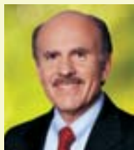
Louis Ignarro Premio Nobel† per la Medicina, Membro dell'Herbalife Nutrition Institute e del Comitato Consultivo Herbalife per la Nutrizione